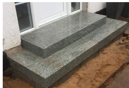
Trin for trin lægges og bagstøbes.