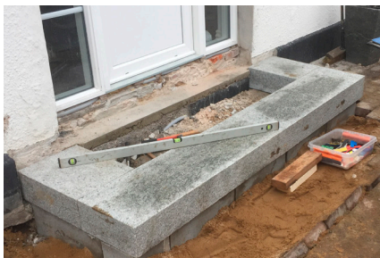
Støbt kerne med lecablokke.