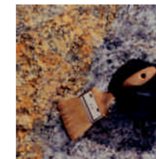
Rust Fjerner Pasta, fjerner rust og beskytter mod yderligere rust.

Anti Grøn fjerner også misfarvninger forårsaget af blomster, træer, blade og fugleklatter eller anden slags genstridig snavs. Vi anbefaler at bruge AKEMI Sten Polering-silikone basis [21] til polerede gravsten. Produktet bevarer den naturlige farve på stenen og fornyer glansen samtidig.