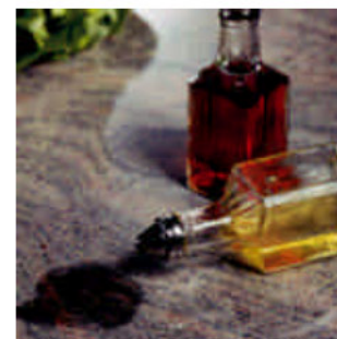
Olie & Fedt Fjerner Pasta fjerner olie og fedtpletter.

Olie og fedtpletter forårsaget af kosmetikprodukter o.lign. Kan fjernes med AKEMI Olie og Fedt Fjerner Pasta [5] .