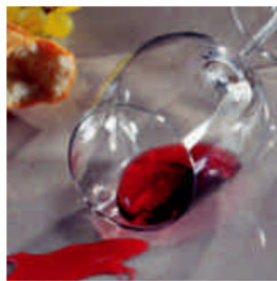
Anti Plet beskytter mod pletter og er ufarlig i forbindelse med fødevarer.